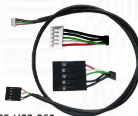
Y05-U02-060 (フロントパネル用 USB 5PIN ケーブル) x1