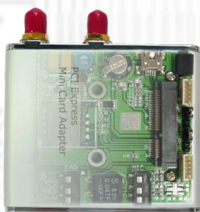
USBMV-D (無線通信 Mini Card 用 USB アダプタ ver1.3) x1 IPX→RP-SMA メス変換 RF ケーブル: 2 本内蔵済