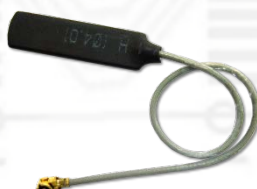
ANT0918-IPX (900/1800MHz 1dBi 内蔵 PCB アンテナ)x2

ビープラス・テクノロジーは 2009 年 3 月以来、高品質のコンピュータ接続製品の製造業者として広範囲のアップグレード用製品を提供してきました。弊社製品はデスクトップ・ノートブック PC を問わず外部周辺機器との橋渡し役としてご好評いただいています。