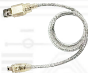
Y05-U04-060 (USB2.0 A オス- ミニ B 5 ピンケーブル 60cm) x1