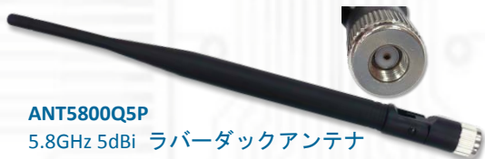
ANT5800Q5P 5.8GHz 5dBi ラバーダックアンテナ