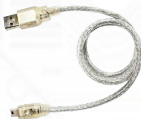
Y05-U04-060 (USB2.0 A オス- ミニ B 5 ピンケーブル 60cm) x1