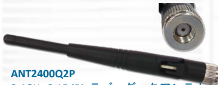
ANT2400Q2P 2.4GHz 2.15dBi ラバーダックアンテナ