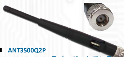
■ ANT3500Q2P 3.5GHz 2.5dBi ラバーダックアンテナ ■ ANT2300Q2P 2.3GHz 2.15dBi ラバーダックアンテナ ■ ANT2500Q2P 2.5GHz 2dBi ラバーダックアンテナ