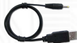
Y05-U17-060 (USB-5VDC 電源ケーブル) x1